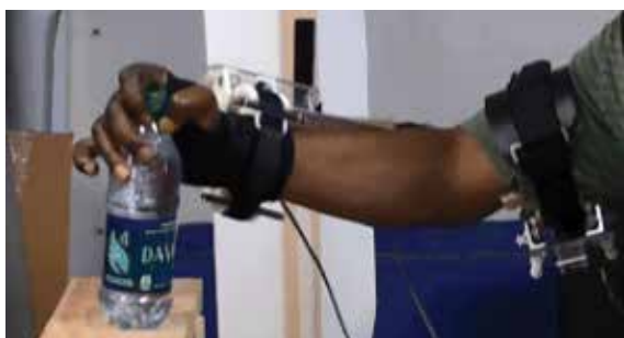
Рис. 2. Применение аппарата SpringWear у пациента после инсульта для выполнения функциональных заданий в процессе терапии

Fig. 1. Compensatory strategy: a – the patient can not clasp the block with his thumb; b – use of the Hand SOME machine in a patient with increased muscle tone after a stroke